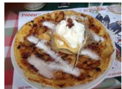
Pannenkoek, bakkerspuding met slagroom