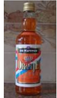
Oranje Bitter (BAH)